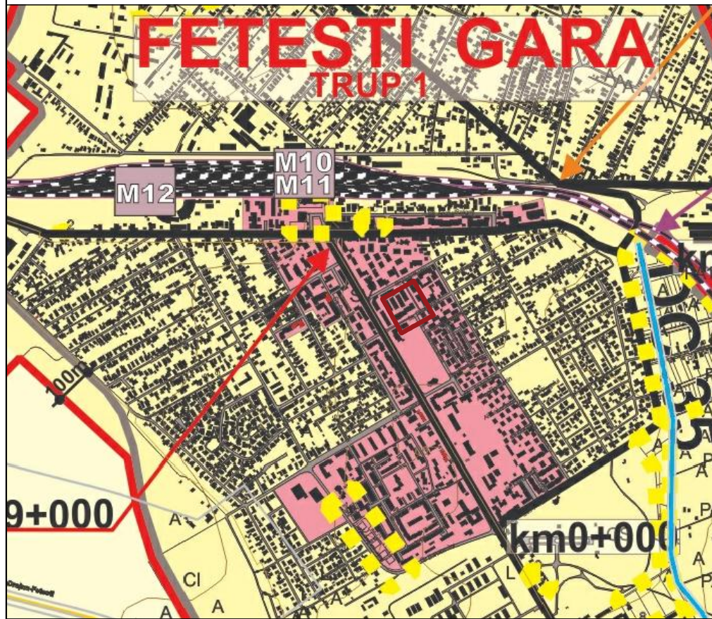
INCADRARE IN P.U.G.